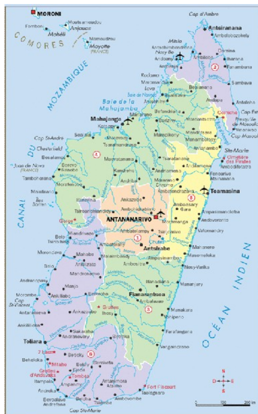
PROVINCES 1 ANTANANARIVO 2 ANTSIRANANA 3 FIANARANTSOA 4 MAHAJANGA 5 TOAMASINA 6 TOLIARA

Mise ne place de taurergeries à proximité des parcs à zébus. Concentration des troupeaux en zone de Mahaso. Mahaso abritera la future laiterie.